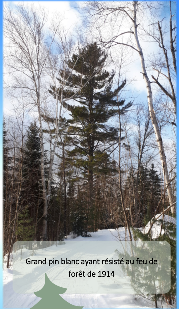
Grand pin blanc ayant résisté au feu de forêt de 1914

Les feux de végétation catastrophiques sont particulièrement préoccupants, car ils présentent une menace directe pour les collectivités et les êtres humains.