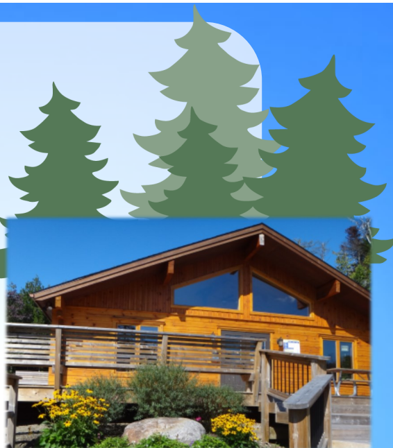
Le refuge, situé sur l'avenue d'Anvers Dans le parc d'Estérel