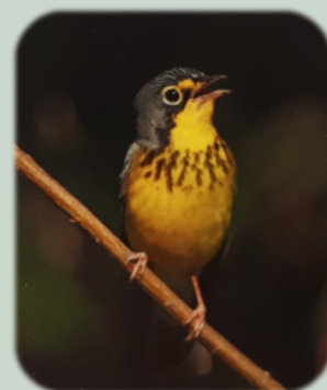
La paruline du Canada

Parmi les animaux de la faune on retrouve en autres des castors, des lièvres, des tamias, des rats musqués, des cerfs de virginie, des dindons sauvages, des canards, des ratons laveurs, des renards et diverses sortes de grenouilles.